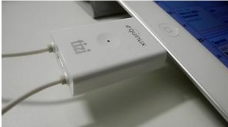
Die kleine Drahtschlinge ist die DVB-T-Antenne. Eine Alternative lässt sich nicht anschließen Matthias Matting

Mit dem Tizi Go wird Fernsehen auf Apples Tablet-Computer iPad 2 endlich richtig bequem. Man kann das iPhone sogar als Fernbedienung benutzen.