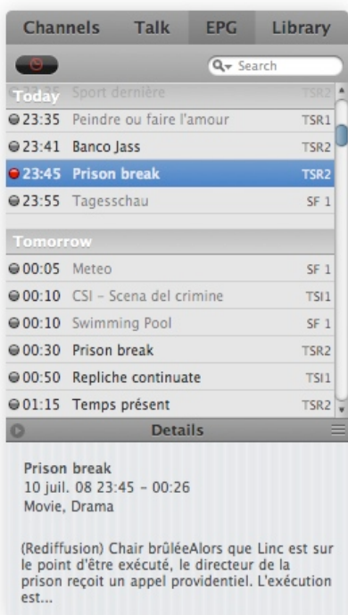
La liste arbore un design à la iPhone

On arrive à l'onglet "EPG", les programmes. Point très important. equinix a abordé un style tout à fait différent qu'Elgato avec ses tableaux chronologiques. On a affaire ici à une "simple" liste, où toutes les émissions de toutes les chaînes sont mélangées. Passé ce point qui plaira (ou pas), il est très aisé de programmer l'enregistrement d'une émission en cliquant simplement sur le point gris, qui deviendra alors rouge. Il suffira de cliquer sur le bouton noir avec une icône d'horloge pour n'afficher que les émissions programmées pour l'enregistrement.